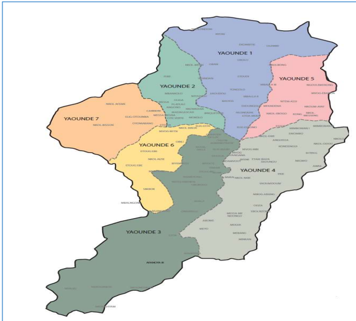
Carte 1: Zone d'étude à Yaoundé.

commune d'arrondissement de Yaoundé 7, créée en 2007, la dernière-née des communes de Yaoundé. En dehors du fait que ces deux sites font office d'espace central, l'une des particularités de ces deux espaces est les principales rues y sont utilisées comme espace commerciaux par les acteurs de l'économie informelle. Par ailleurs des affrontements entre gouvernants et acteurs de l'informel y sont quasi-quotidiennes. Le travail a voulu comprendre pourquoi depuis les années 1960 les dirigeants de Yaoundé ont du mal à éjecter les débrouillards du centre-ville. Mais également pourquoi le dernier arrondissement intégré dans le périmètre urbain de Yaoundé fait face aux mêmes difficultés.