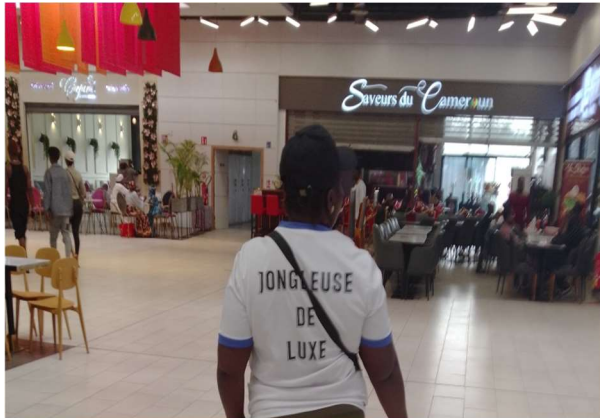
le 21 avril 2025

Photo 1 : Une débrouillardise qui brandit son statut de « jongleuse » dans un supermarché