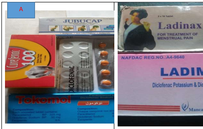
Planche n°3 : portant sur les types de noms de la diclofénac.