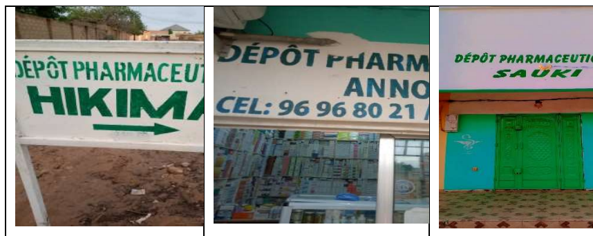
Planche n°2 : portant sur la toponymie des dépôts et pharmacies locales attestant la circulation de significations et des systèmes opératoires de ventes et d'achats.

dans les places publiques, les carrefours, les petits marchés sous les noms des héros, des grands commerçants, des grands intellectuels servent de base pour décrire l'émergence des motifs d'achats et de négociations thérapeutiques. C'est pourquoi la majorité des interviewés se rattache à des anthroponymes 2 issus de noms des autochtones qui sont le reflet particulier des rapports aux médicaments, sous différentes représentations. Ainsi, il s'agit dans chaque cas d'achat, d'examiner les rapports centres-achats qui dépendent des revenus familiaux et de système de préférence. De ce fait, la majorité des interviewés se rattache à ces lieux privilégiés qui sont le reflet des rapports particuliers entre les représentations vis-à-vis des noms des centres et les modes d'achats